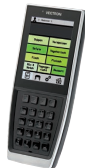
POS MobilePro III

Auch für Verkaufsfahrzeuge und mobile Verkaufsstände sind Vectron-Kassen die perfekte Wahl.