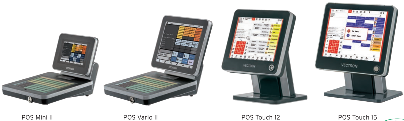
POS Mini II

Ausweisung von Allergenen, Nährwerten etc. - umgehend angepasst. So bleibt Ihr System mit Software-Updates über viele Jahre aktuell. Als nicht PC-basierte Systeme sind Vectron-Kassen perfekt vor Viren, Trojanern und Manipulationen geschützt. Sie benötigen keine Internetverbindung und Ihre sensiblen Kassendaten sind im Kassenspeicher - und nicht in einer Cloud - bestens aufgehoben.